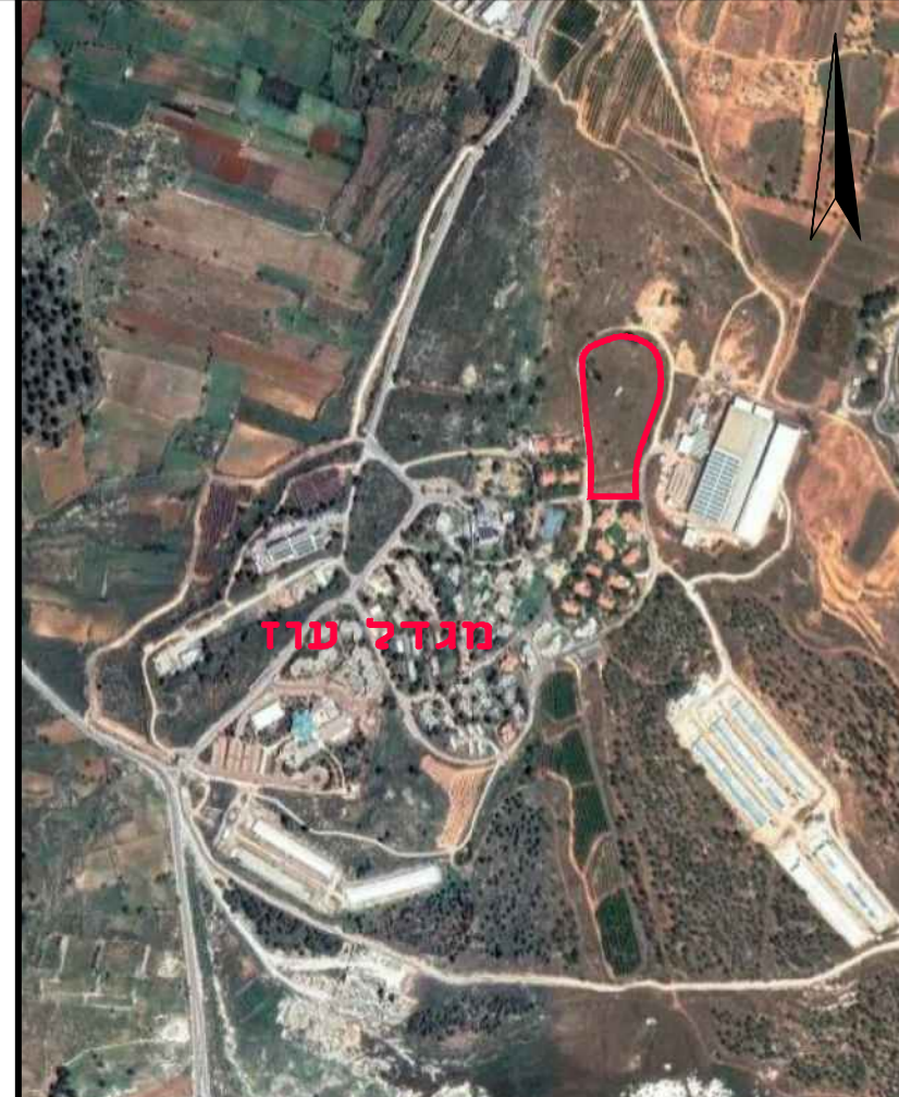
תרשים התמצאות ללא קני"מ